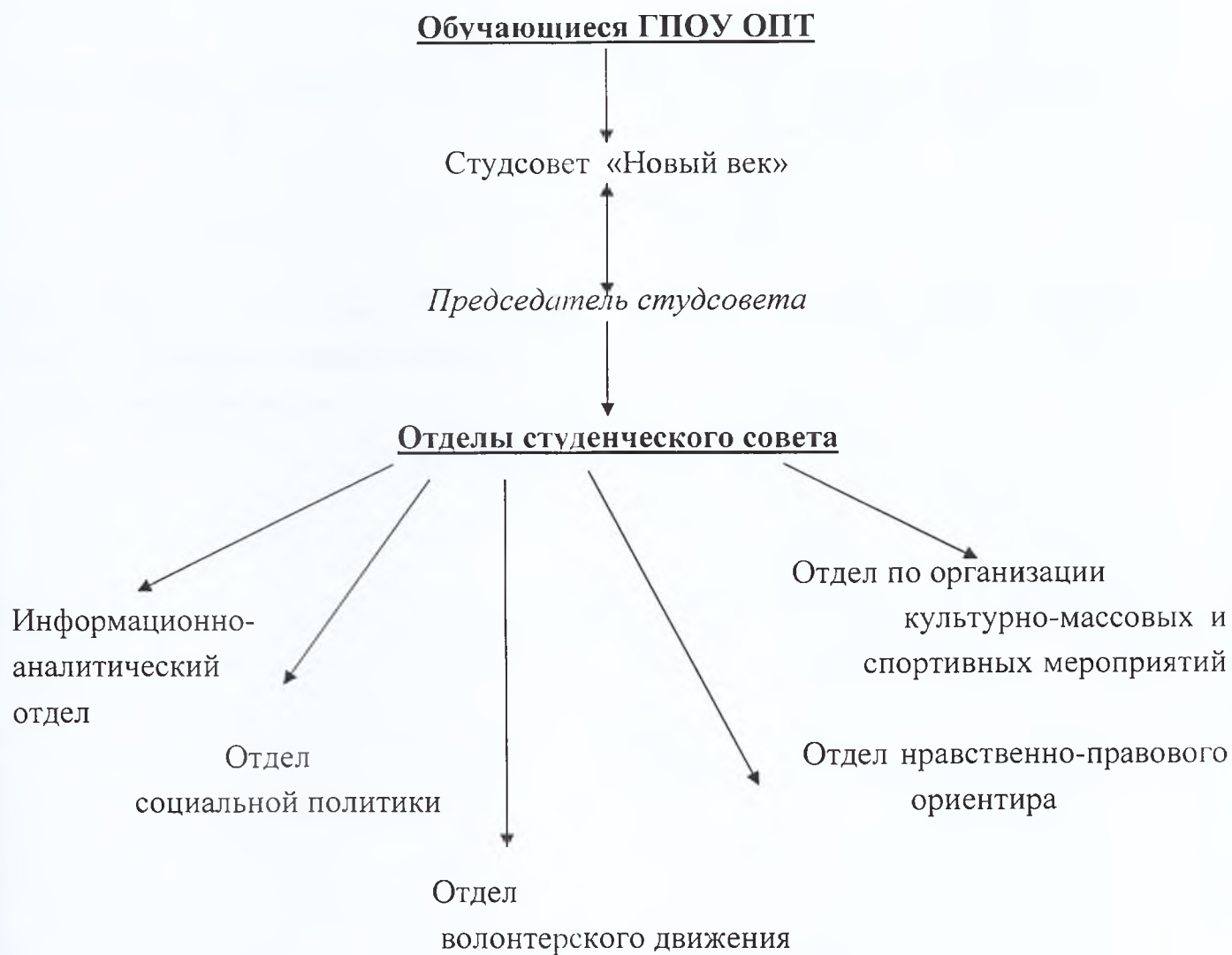
Схема - структура студсовета «Новый век»